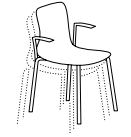
LP/SD/RL/PB 56 x 53 x 89 x 47