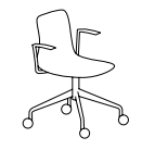
LP/SD/4LK/PB 55 x 54 x 86 x 48